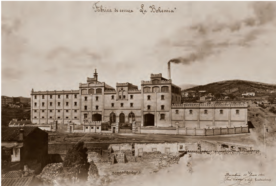
FIGURA 4. Fàbrica del carrer del Rosselló.