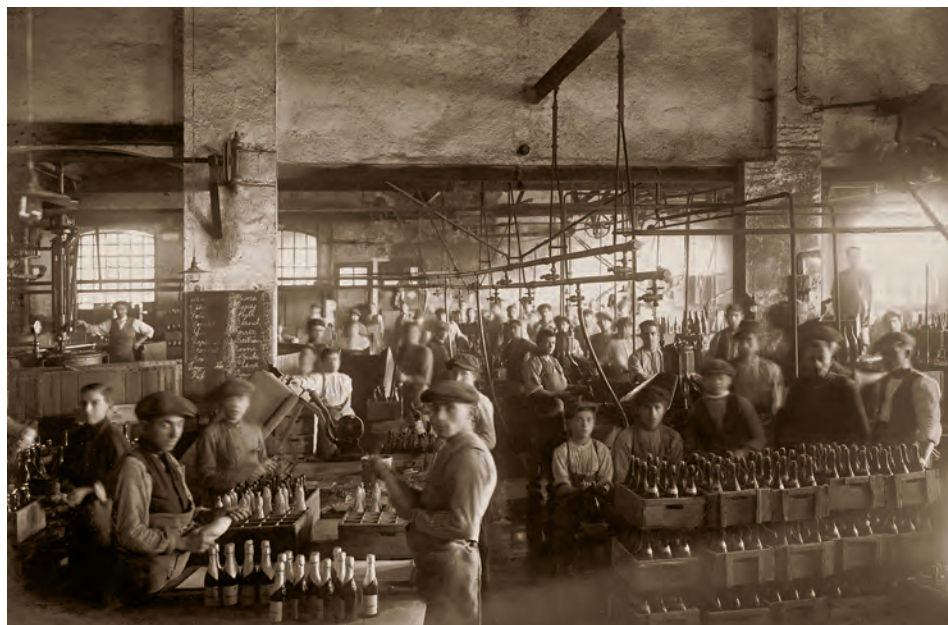
FIGURA 5. Empleats d'envasament (anys vint).

La Bohemia envasava la major part de la cervesa de l'Anònima i era des d'allà des d'on se'n repartia el gruix més important. Encara avui en dia es conserven algunes de les màquines que s'empraven per omplir els barrils i les ampolles (peces ja històriques).