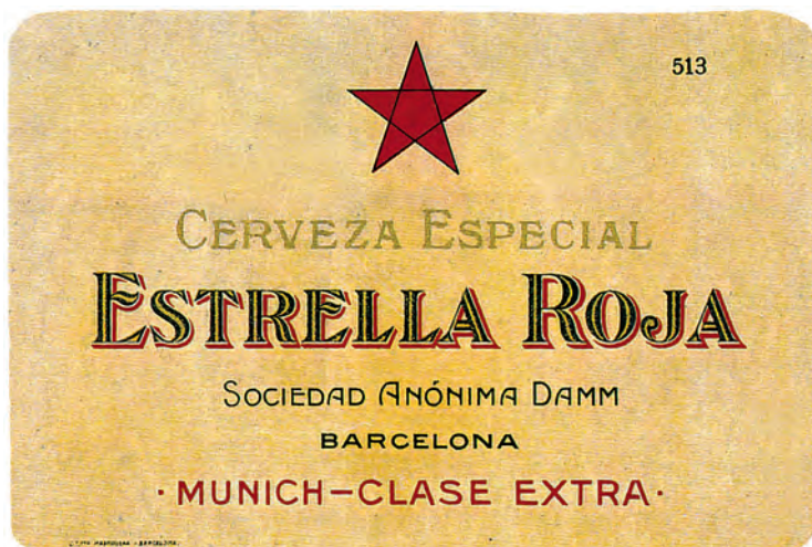
FIGURA 6. Etiqueta de la famosa Estrella Roja (1928).

A finals del 1921, sobre la base de la primera Pilsen de Damm s'elaborarà una varietat especial, d'una qualitat encara superior: l'Estrella Dorada, amb la qual l'empresa va forjar bona part del seu èxit comercial. L'any 1991, Estrella Dorada va canviar el nom per convertir-se en Estrella Damm. En aquella època, durant els Jocs Olímpics de Barcelona, encara es podia trobar cristalleria d'Estrella Dorada amb cristalleria d'Estrella Damm.