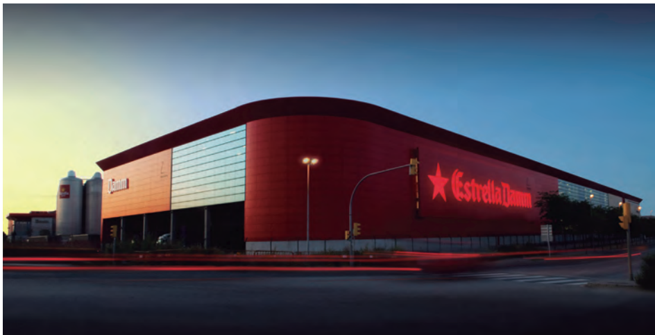
FIGURA 10. Fàbrica del Prat de Llobregat.

exemple, Estrella Damm Barcelona va ser la cervesa oficial dels premis The World's 50 Best Restaurants, a Melbourne, i dels Latin America's 50 Best Restaurants 2017, a Bogotà.