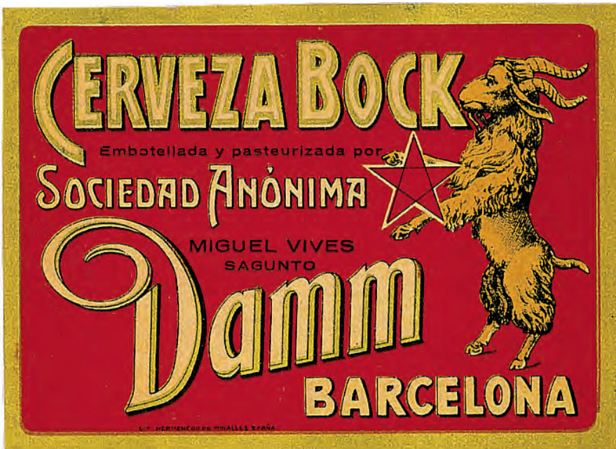
FIGURA 7. Etiqueta de la cervesa Bock Damm.

Un cop «recuperada» l'activitat de l'empresa (o en procés de recuperació), SA Damm va participar a la Fira de Barcelona, la qual va ser un èxit pel que fa a