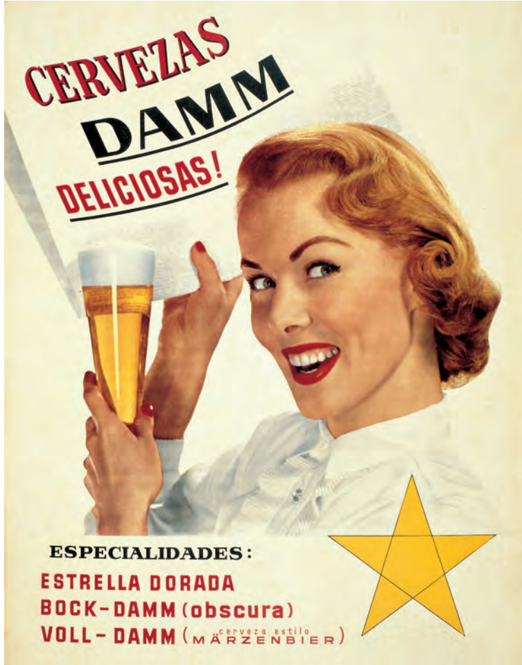
FIGURA 8. Famós cartell publicitari dels anys cinquanta.

internes per part del Govern no s'adaptaven a la situació. A part, l'atenció del país se centrava en la mort del general Franco, que va causar una transició molt complicada. El mercat de la cervesa havia de fer front a diversos factors: l'increment de la producció i venda de cervesa, la gran competència entre empreses (entre les quals n'hi havia moltes de noves), la reducció de marges comercials, i les grans inversions necessàries per tirar endavant. SA Dammm va haver d'endeutar-se en diverses ocasions, cosa que va generar l'emissió d'obligacions i operacions de crèdit bancari (Francesc Cabana, 2001, p. 194).