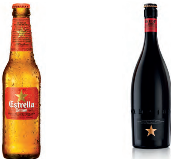
FIGURA 1. Ampolla d'Estrella Damm i ampolla de cervesa Inèdit.

Fundada el 1876 pel mestre cerveser August Kuentzmann Damm, la cervesera Damm és avui en dia una de les empreses més rellevants del sector de l'alimentació i les begudes. Durant aquests més de cent quaranta anys d'història, la companyia ha evolucionat fins a convertir-se en tota una icona social. Actualment l'empresa està present en més de vuitanta-cinc països de tot el món amb marques tan reconegudes com Estrella Damm, Voll-Damm i Free-Damm, així com amb les d'aigua mineral Veri i Fuente Liviana. Avui en dia, Damm, amb descendència de la família fundadora encara estretament vinculada amb la companyia, continua escrivint la seva història dia rere dia amb un equip humà de gairebé tres mil persones.